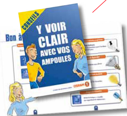
Guide conseil - Pagivole