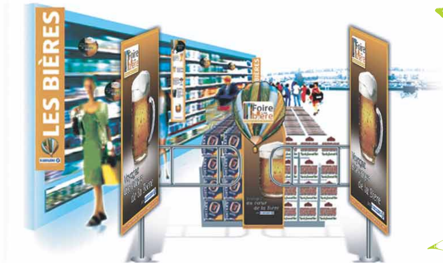
Mise en situation